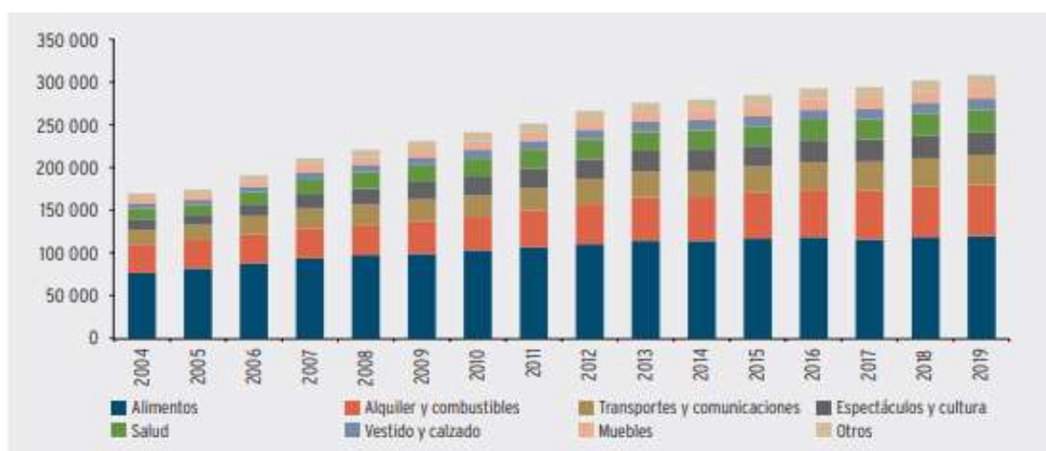
Figura 1: Gasto total mensual por tipo de bien.

Asimismo, siendo el consumo privado el componente más importante del PBI, resulta importante analizar la descomposición del consumo privado a través del gasto total mensual estimado por tipo de bien, cuya información se recolecta de la Encuesta Nacional de Hogares (ENAH) que es aplicada por el Instituto Nacional de Estadística e Informática del Perú (INEI). A través de la figura 1, se puede observar la descomposición del gasto de la economía peruana entre los años 2004 y 2019 (Asencios & Castellares, 2021). (Asencios & Castellares, 2021)