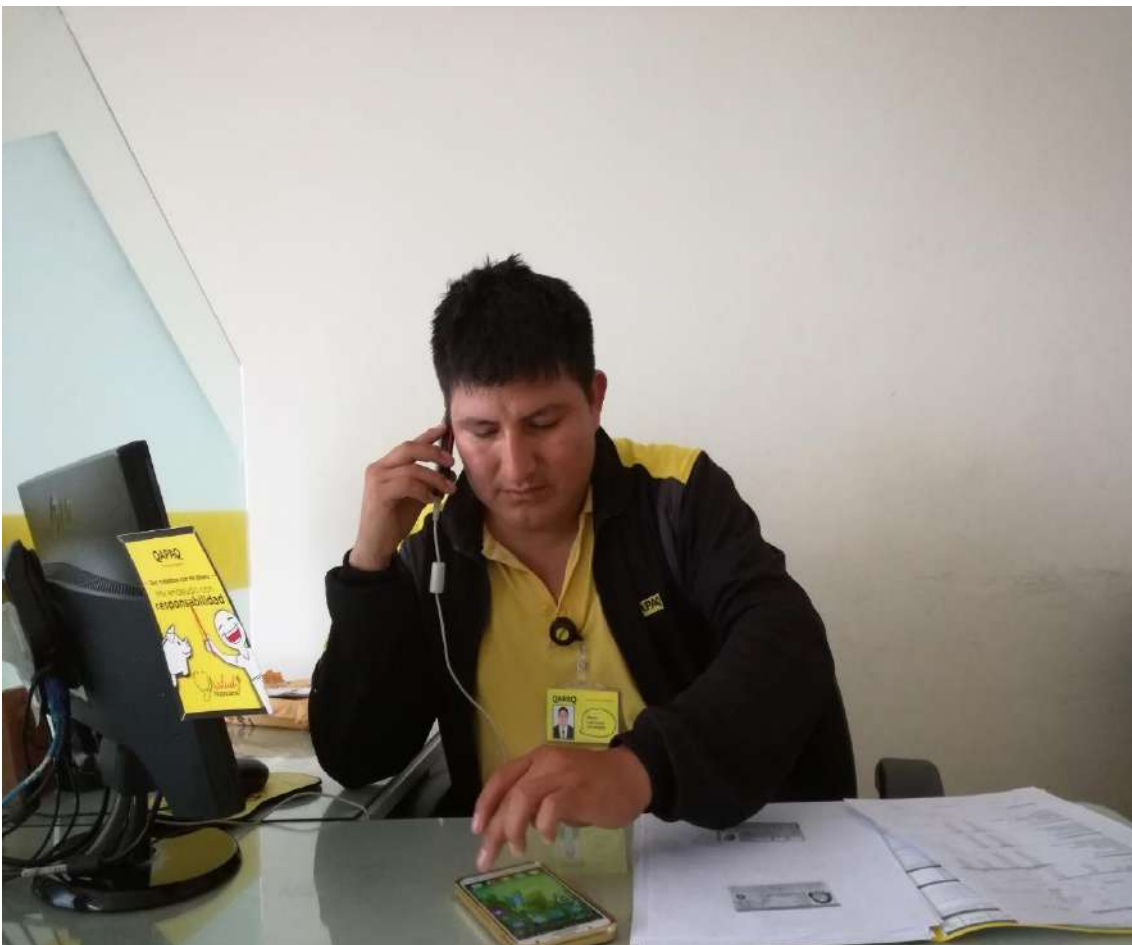
Figura 13. El analista de créditos realizando las coordinaciones para el desembolso.