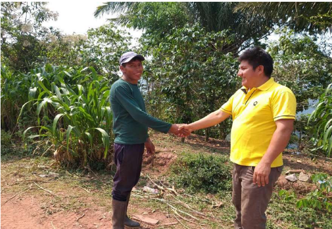
Figura 7. Los nuevos clientes podrán acceder créditos agrarios para mejorar sus cafetales adicionalmente ser partícipe de las capacitaciones del técnico especialista en la producción de café.