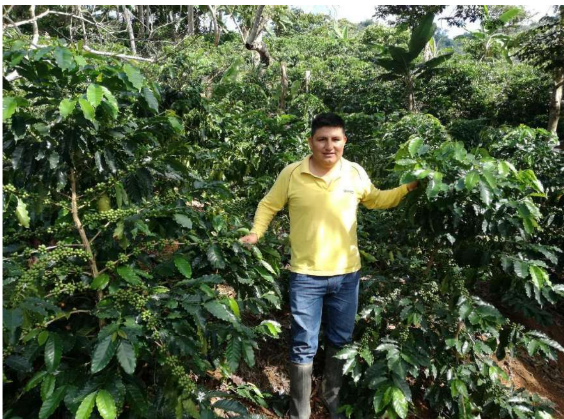
Figura 15. El analista del crédito agrario realizando la supervisión de campo.