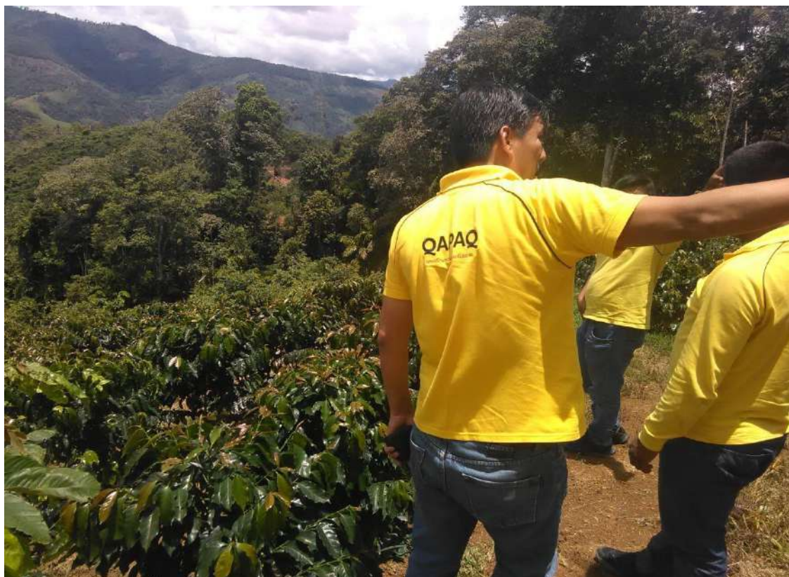
Figura 14. Las visitas contantes van a garantizar una buena producción.