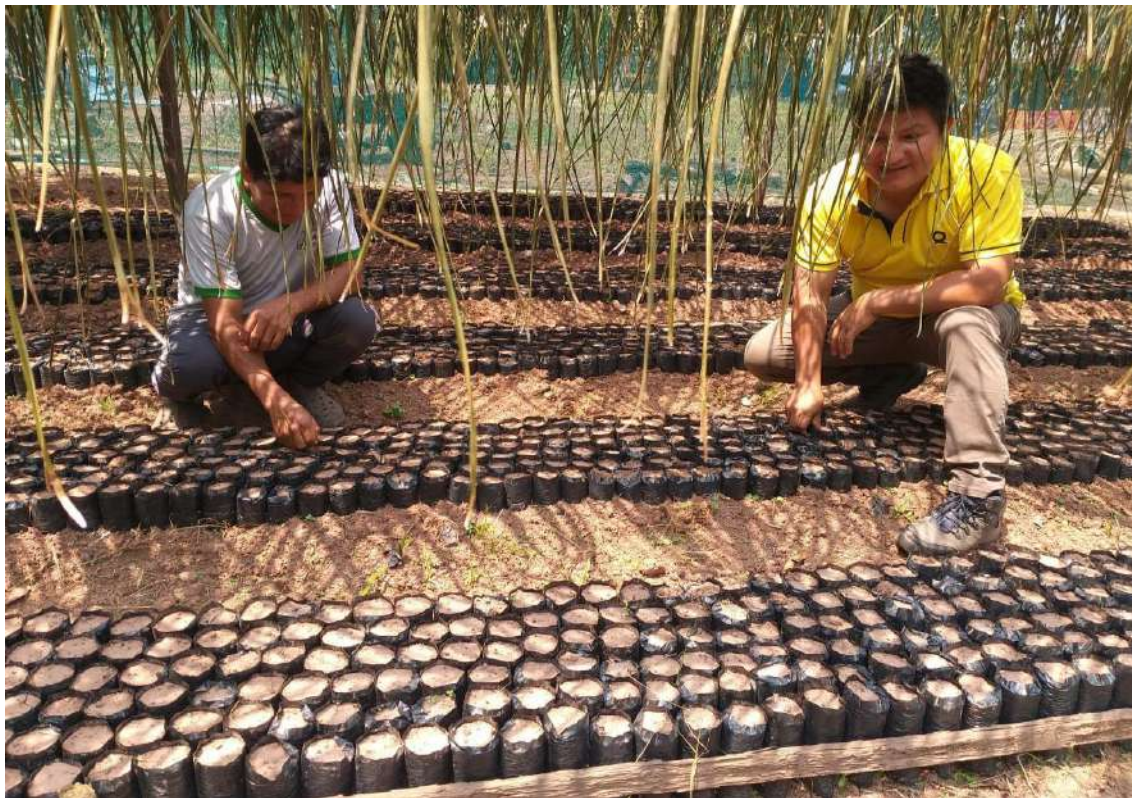
Figura 3. El agricultor utilizó el crédito agrario para la instalación de nuevas plantaciones decafé.