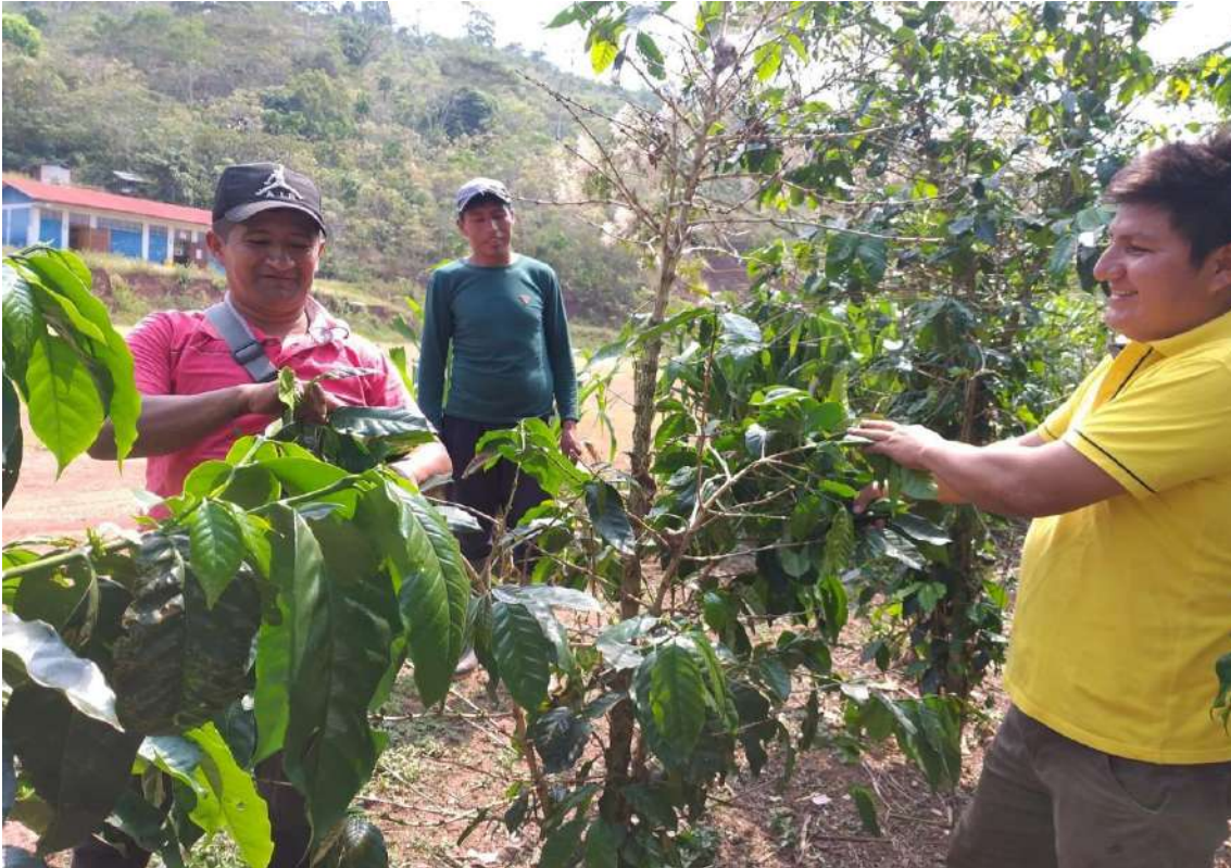
Figura 6. Con las capacitaciones INSITU se puede atraer más clientes, ya ellos serán testigos del trabajo de asesoramiento brindado y sus resultados.