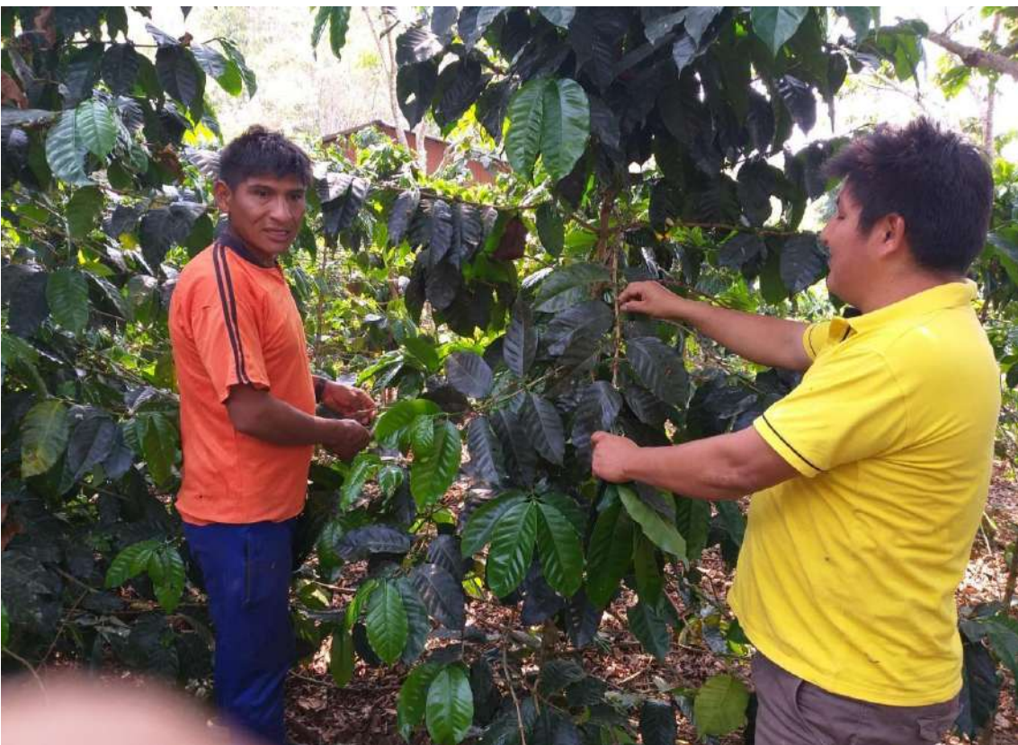
Figura 5. Con las capacitaciones INSITU se pueden garantizar un aumento en la producción y así asegurar el retorno del crédito adquirido.