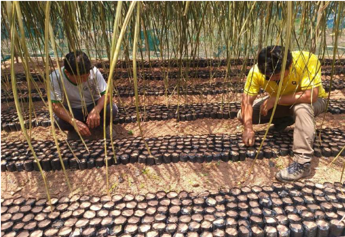
Figura 2. Asistencia técnica en vivero de café en la zona de Villa el Sol.