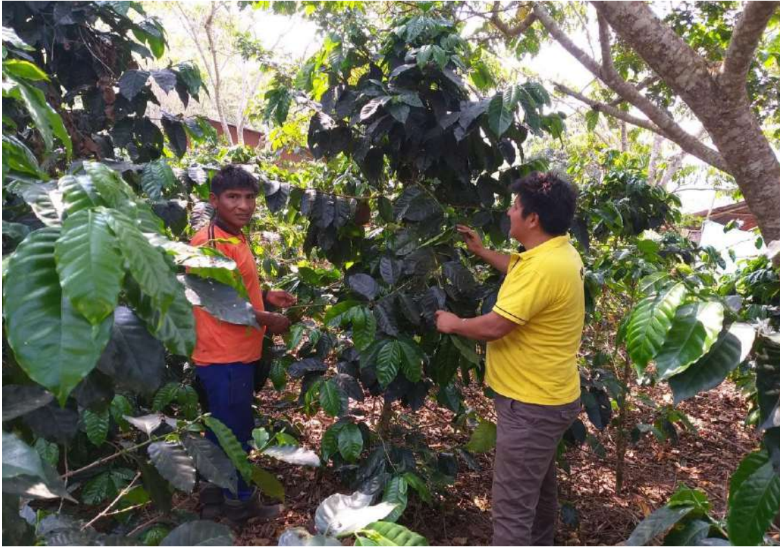
Figura 4. En la imagen se muestra al analista agrario revisando las plantaciones de café.