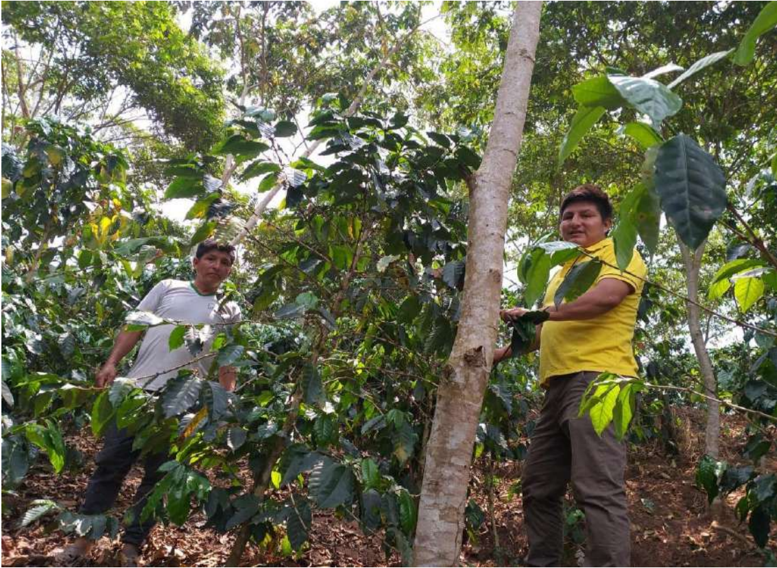
Figura 8. La elaboración del plan de trabajo se realizará de acuerdo a las necesidades del campo de cultivo del productor.