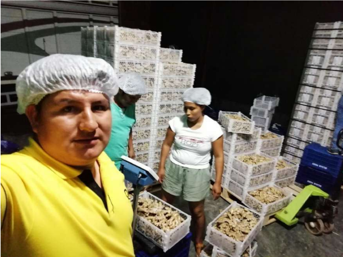
Figura 10. En el cultivo de kion es, recomendable como técnico verificar contantemente la producción.