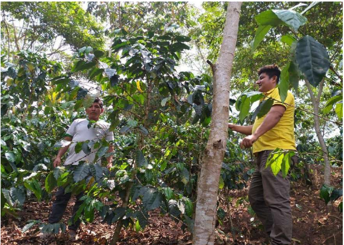
Figura 9. El plan de trabajo se elabora conjuntamente con el agricultor.