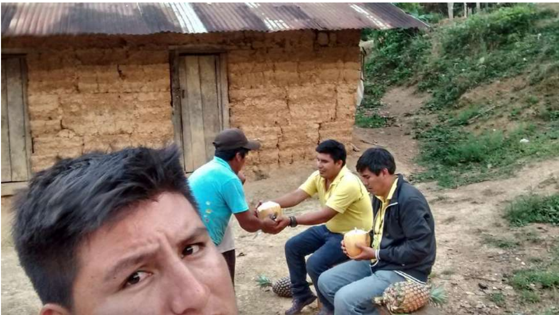
Figura 11. Las capacitaciones con apoyo de otros profesionales especialista en los cultivos pueden fortalecer los conocimientos de los productores.