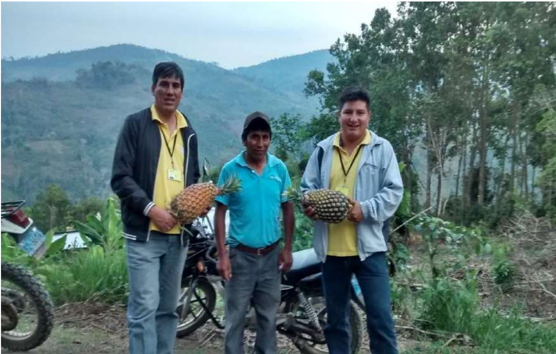
Figura 12. Cliente productor del cultivo de piña con su primera producción con el apoyo de financiera QAPAQ.