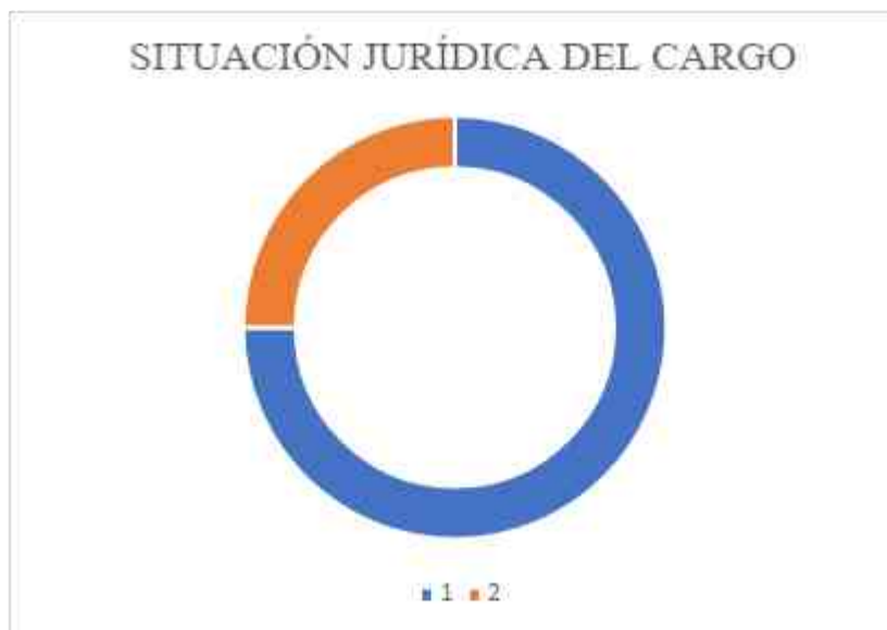
Figura 3. Nivel cualitativo 3: Situación Jurídica del Cargo

En relación con la Figura 3, se puede observar que del 100% (4), de encuestados que ejercen funciones en el ámbito público, el 75% (3) son nombrados, y el 25% (1) es contratado.