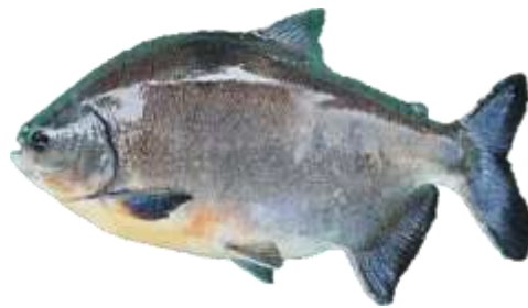
Figura 1: Gamitana C. macropomum (García, et al., 2018)

Especie: Colossoma macropomum (Cuvier, 1816)