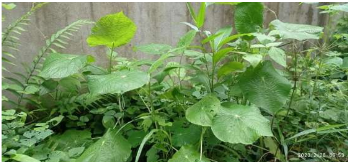
Anexo 4 Planta de Santa María, Piper peltatum L