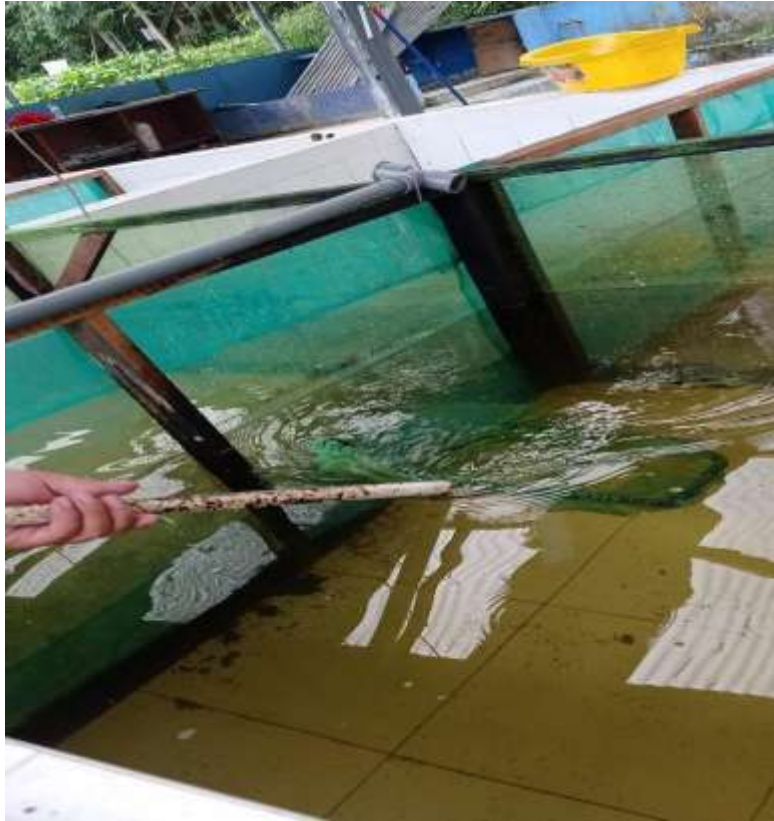
Anexo 5 Captura de alevinos de C. macropomum