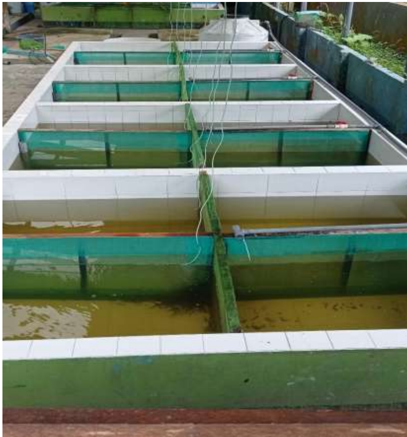
Anexo 6 Unidades experimentales