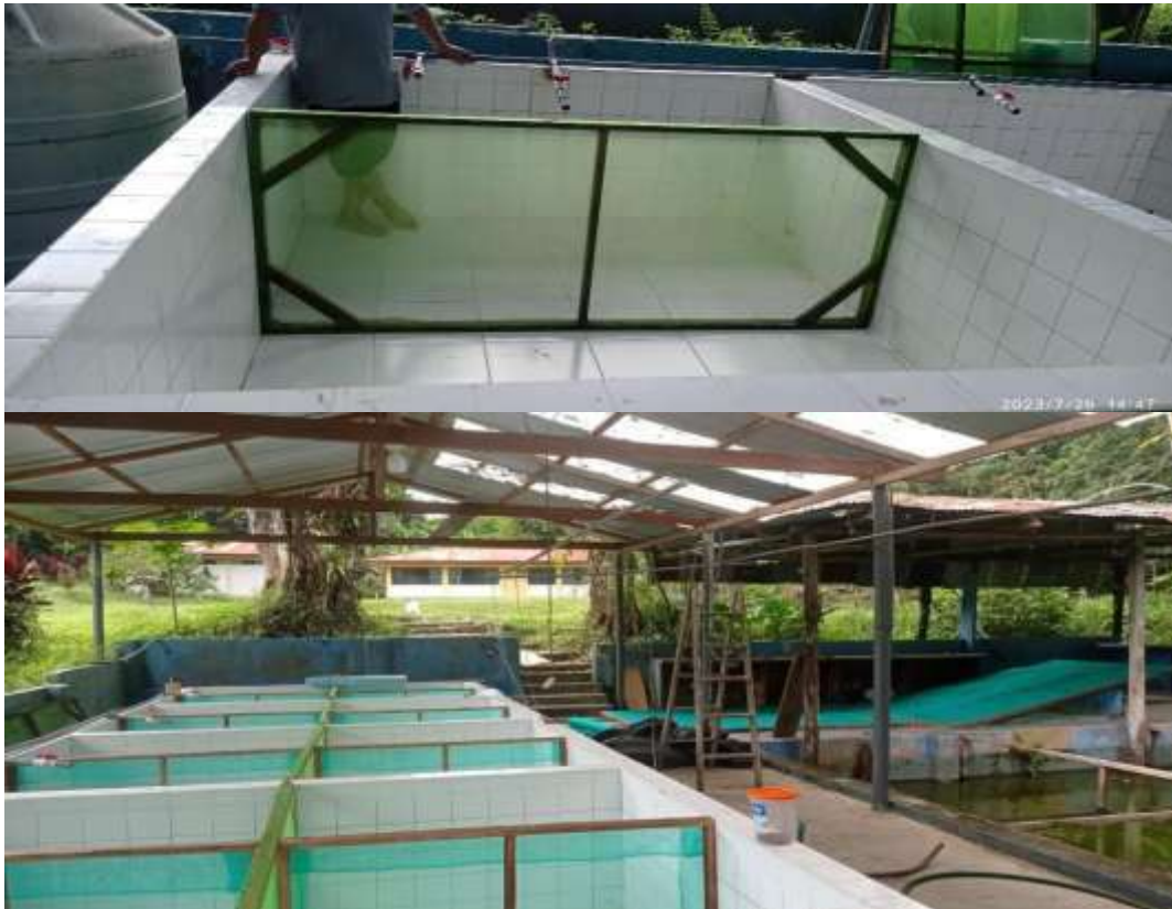
Anexo 1: Armado de las unidades experimentales