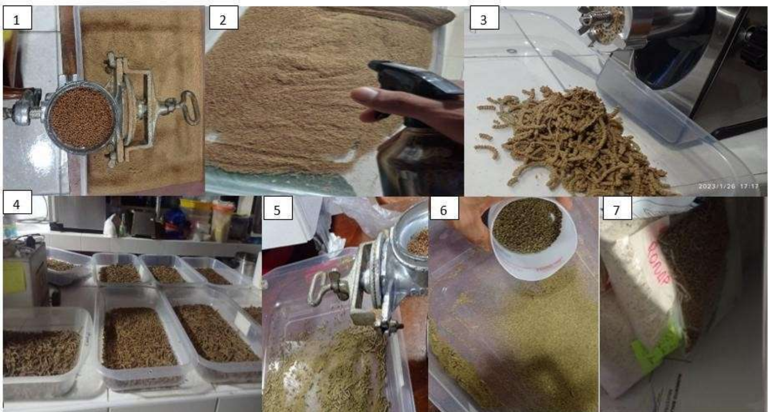
Figura 5. Inclusión del extracto etanólico en el alimento balanceado. 1: Molido del alimento balanceado, 2: Mezcla del extracto con el alimento, 3: mezcla con la inclusión de extracto procesada, 4: secado del alimento balanceado, 5: Molida para granular a la medida requerida. 6: Alimento balanceado antes de ser almacenado. 7: Alimento balanceado almacenado a 4° c

El alimento balanceado usado en esta experimentación corresponde a la marca “Aquatech, gamitana 32” de 2 mm. Se utilizó el molino para pulverizar el alimento balanceado. El extracto etanólico se disolvió en la proporción de 100- 200 ml de alcohol para 1 gramo de extracto etanólico. Se vertió esta concentración en un frasco con pulverizador y la concentración es agregado al alimento balanceado y revuelto para obtener una mezcla uniforme. Se dejó reposar un par de horas mientras el alcohol se volatilice. Una vez terminado el anterior proceso se le agregó agua hervida tibia en una concentración de 60 ml por cada 100 gramos de alimento con inclusión de extracto etanólico. Se mezcló bien y se agregó a una “maquina procesadora” para obtener el alimento en forma de fideos o tiras largas que fueron colocados por 24 horas en la estufa (45°C). Una vez secos, se procesaron en molino sin ajustar demasiado sus placas, fue tamizado para obtener el tamaño requerido y posteriormente fueron almacenados en refrigeración (4°C) en recipientes protegidos de la luz hasta su uso.