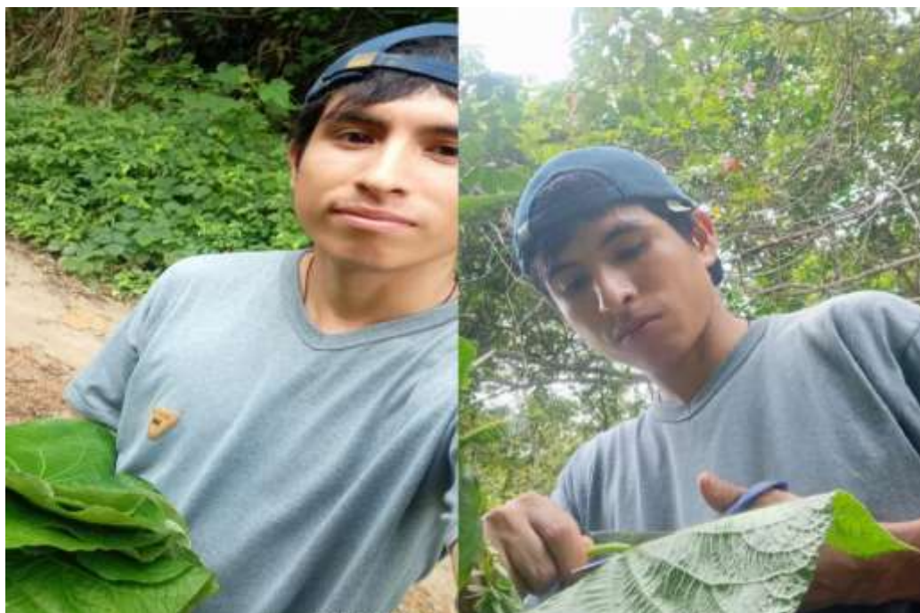
Anexo 3: Recolección de hojas de Santa María