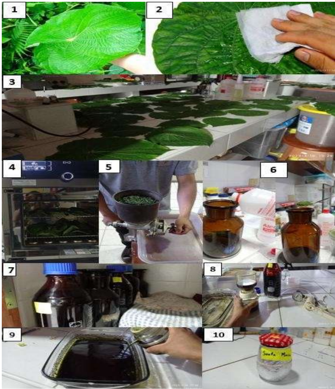
Figura 4. Obtención de extracto etanólico. 1: Colecta de hojas, 2: limpieza de impurezas, 3: Primer secado con aire, 4: Resecado, 5: Molido de hojas, 6: preparación del macerado, 7: Almacenamiento del macerado, 8: Filtración del macerado, 9: Extracto antes de la volatilización del solvente, 10: Extracto cosechado y almacenado

y oscuro durante aproximadamente 5 días. Terminado el proceso anterior se filtró el macerado al vacío usando un embudo de filtración incorporado a una bomba al vacío, mediante el uso de papel filtro, para separar el extracto de otros restos de hoja molida. El extracto filtrado fue vertido en un recipiente de vidrio (pírex), cubierto con una tela delgada para evitar el ingreso de contaminantes y se colocó en un espacio libre de luz. El disolvente se volatilizó en 10 días aproximadamente y el extracto fue cosechado y almacenado en un recipiente de vidrio protegido de la luz y refrigerado a 4° C aproximadamente.