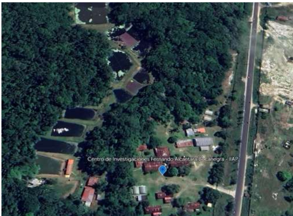
Figura 3 Centro de Investigaciones Fernando Alcántara Bocanegra - IIAP