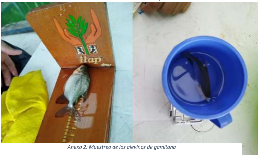
Anexo 2: Muestreo de los alevinos de gamitana