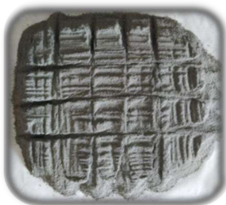
Figura 20. Método del incremento para caracterización del mineral.

Investigación a realizar, el mineral se pesa 5 kg a 100% malla – 10 y se homogeniza por coneo luego se procedió a cuartear hasta obtener 1 kg de mineral representativa. Esta muestra representativa de 1 kg de mineral se homogenizo y se realizó el muestreo por método de incremento, para tomar una muestra de 250 g que se utilizara para la caracterización del mineral.