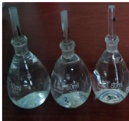
Figura 21. Picnómetro con agua