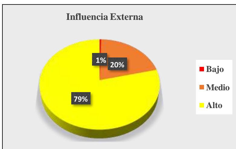
Figura 3. Ilustración niveles de dimensión de influencia externa