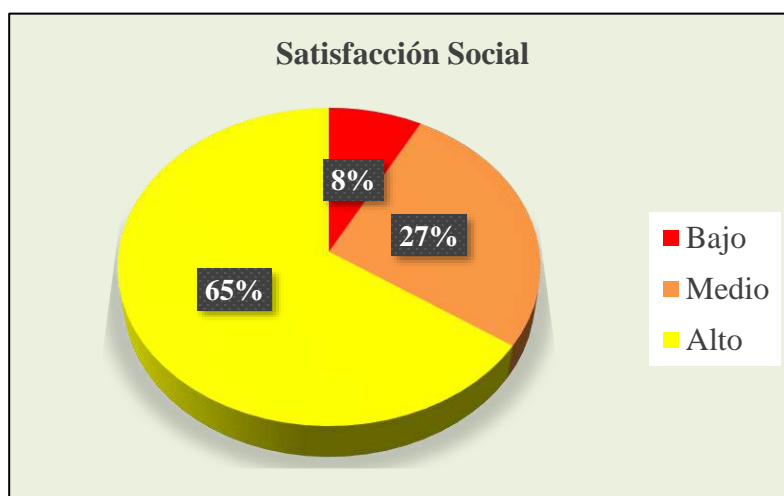
Figura 4 Ilustración de los niveles de dimensión de satisfacción social