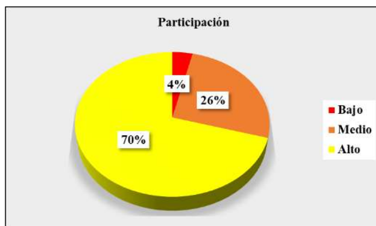
Figura 2. Ilustración niveles en dimensión de participación