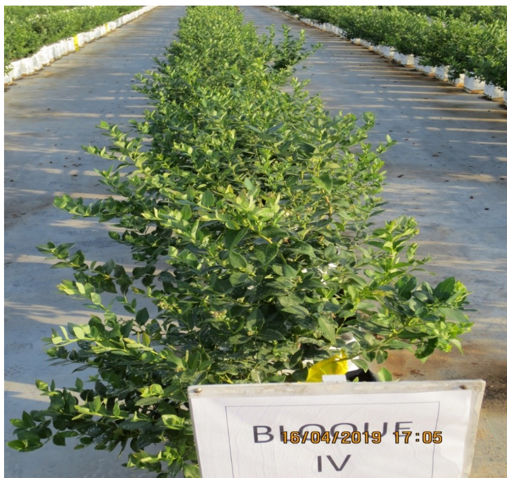
Figura 7. Distribución de bloques.