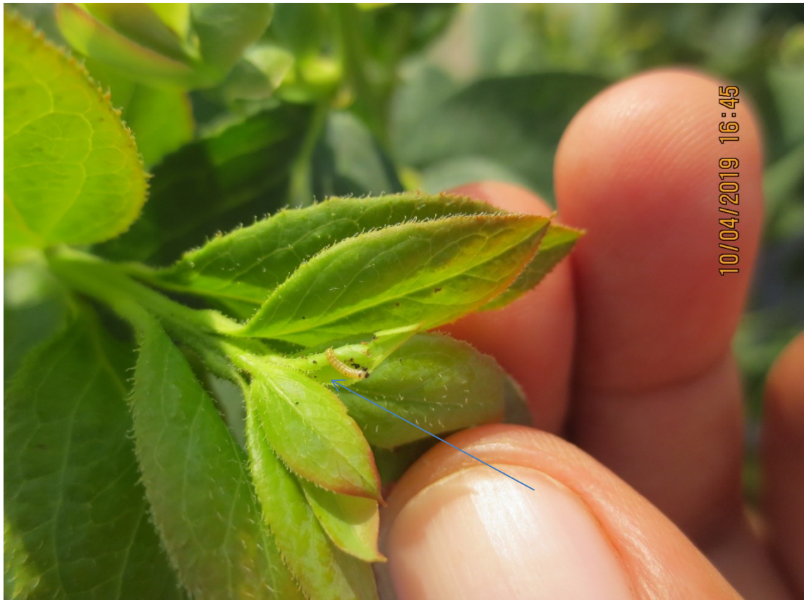
Figura 2. Inicio de infección de Bioxter (Capsaicina), paraliza el movimiento de la larva