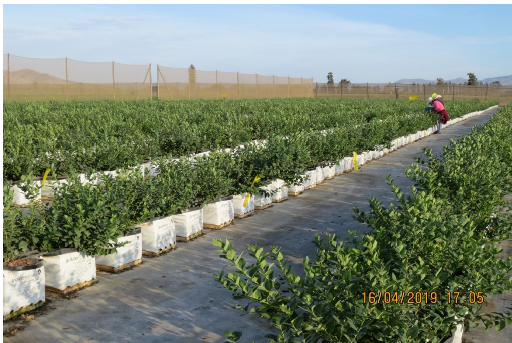
Figura 6. Evaluaciones y distribución de tratamientos.