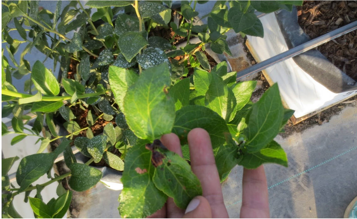
Figura 4. Daño ocasionado por Heliothis virescens . Tratamiento Testigo.