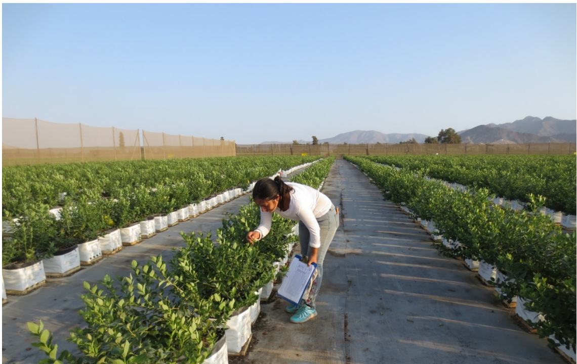
Figura 5. Evaluación días posteriores a la aplicación.