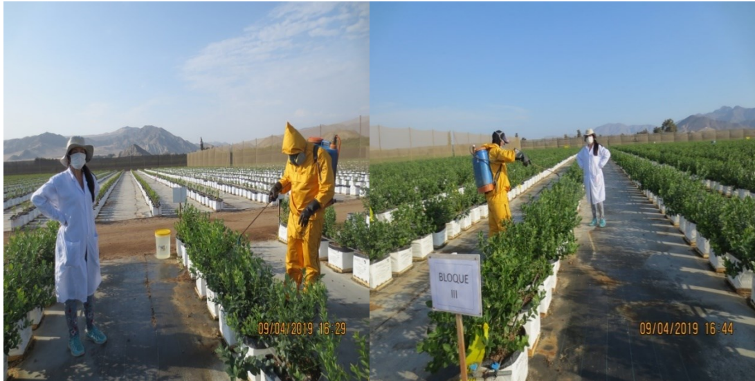
Figura 1. Aplicación de tratamientos