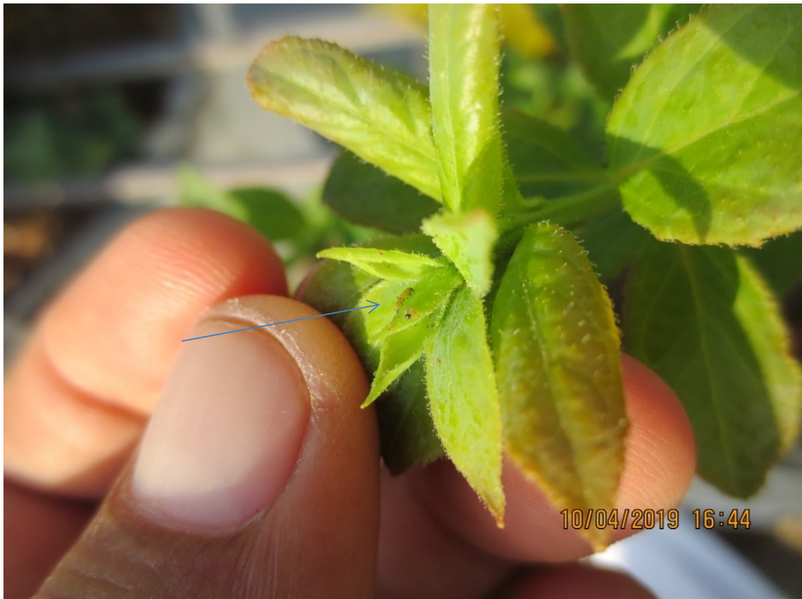
Figura 1. Infección inicial de Bacillus thuriengensis