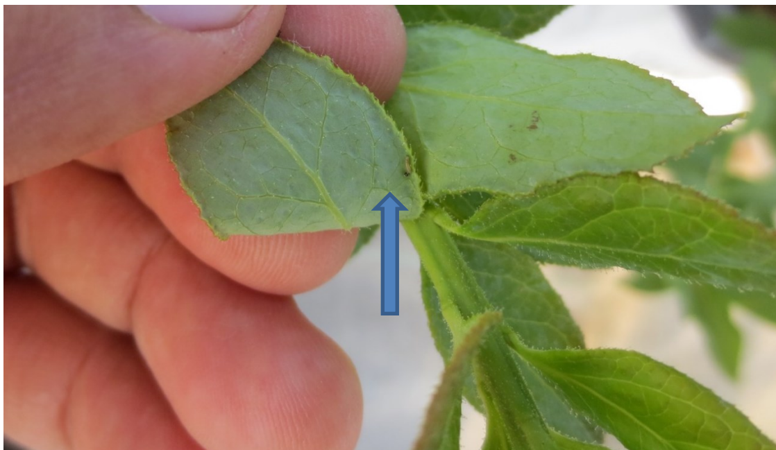
Figura 3. Inicio de infección de Virus de la polihedrosis (Inicio de necrosamiento de la larva)