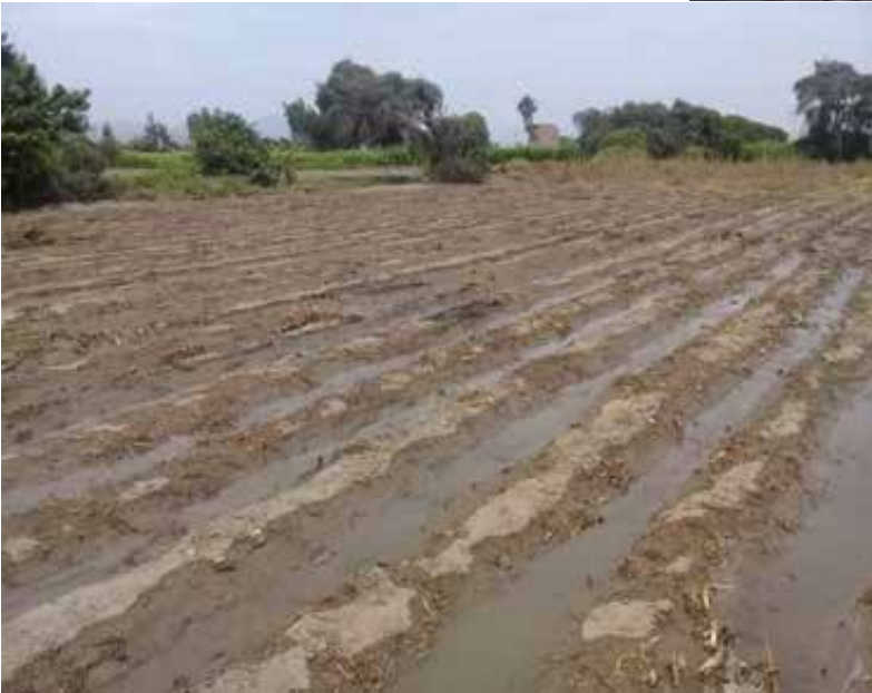
Figura 7. Riego de machaco