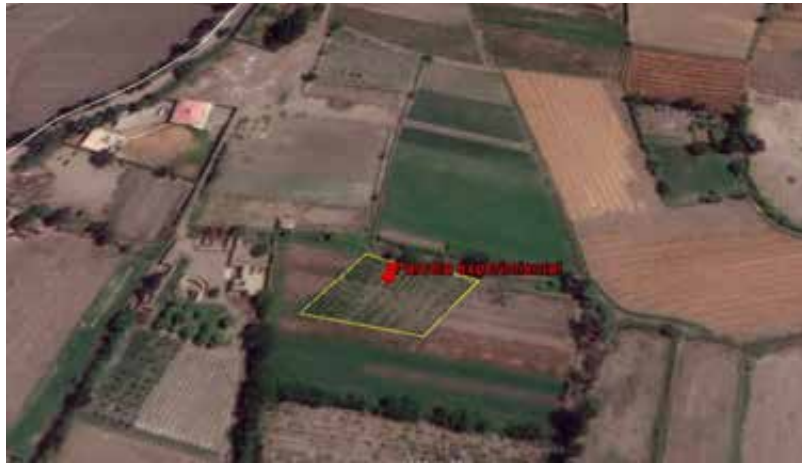
Figura 1. Distribución geográfica de la parcela experimental de cultivos asociados.