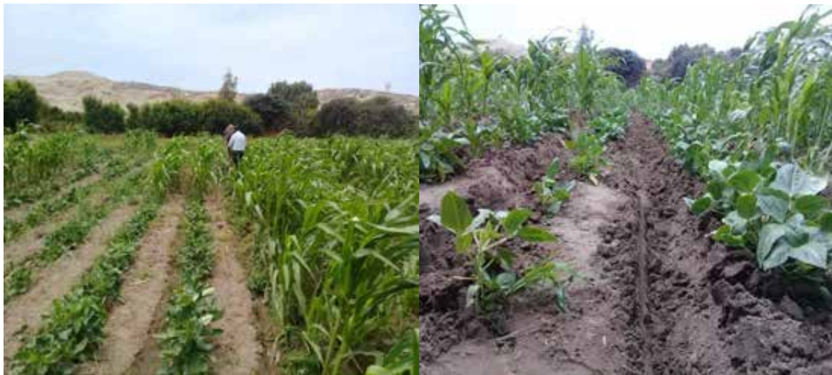
Figura 11. Aporque.