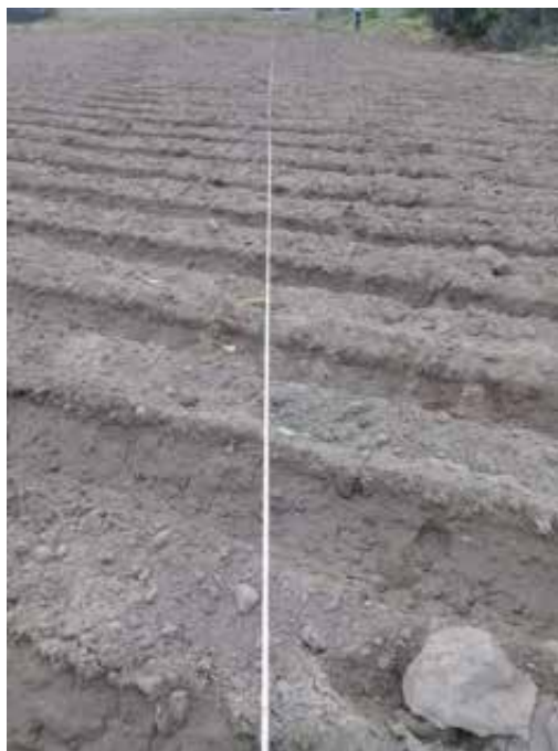
Figura 9. Alineado y marcado de los bloques