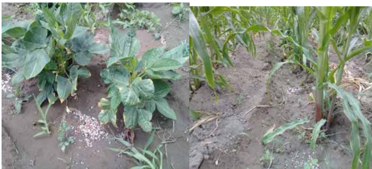
Figura 10. Fertilización con urea + 20-20-20