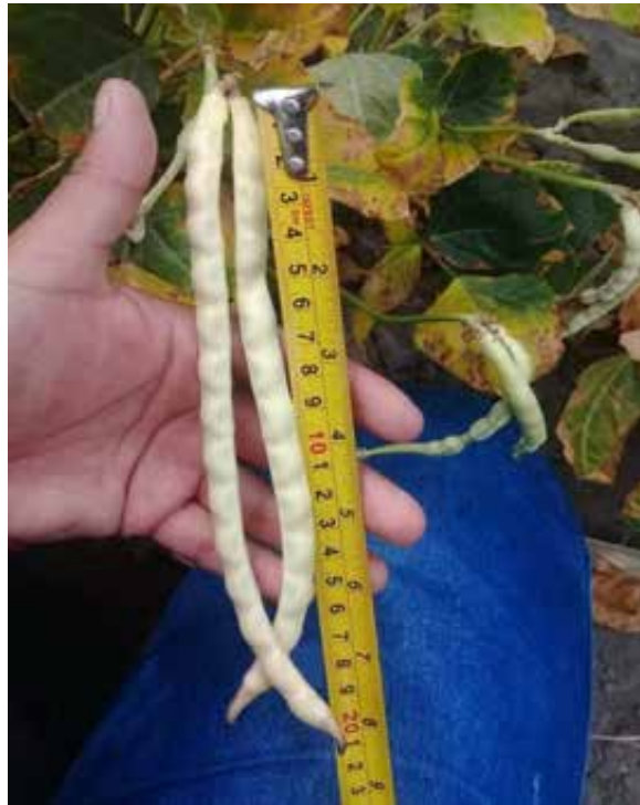
Figura N° 13. Evaluación longitud de vaina