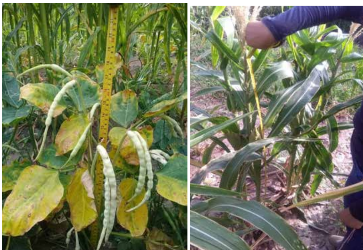
Figura 12. Evaluación altura de planta