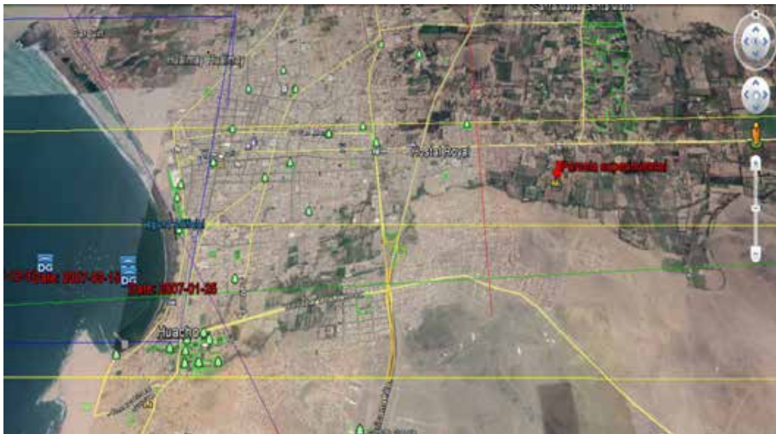
Figura 2. Ubicación de la parcela experimental de cultivos asociados.