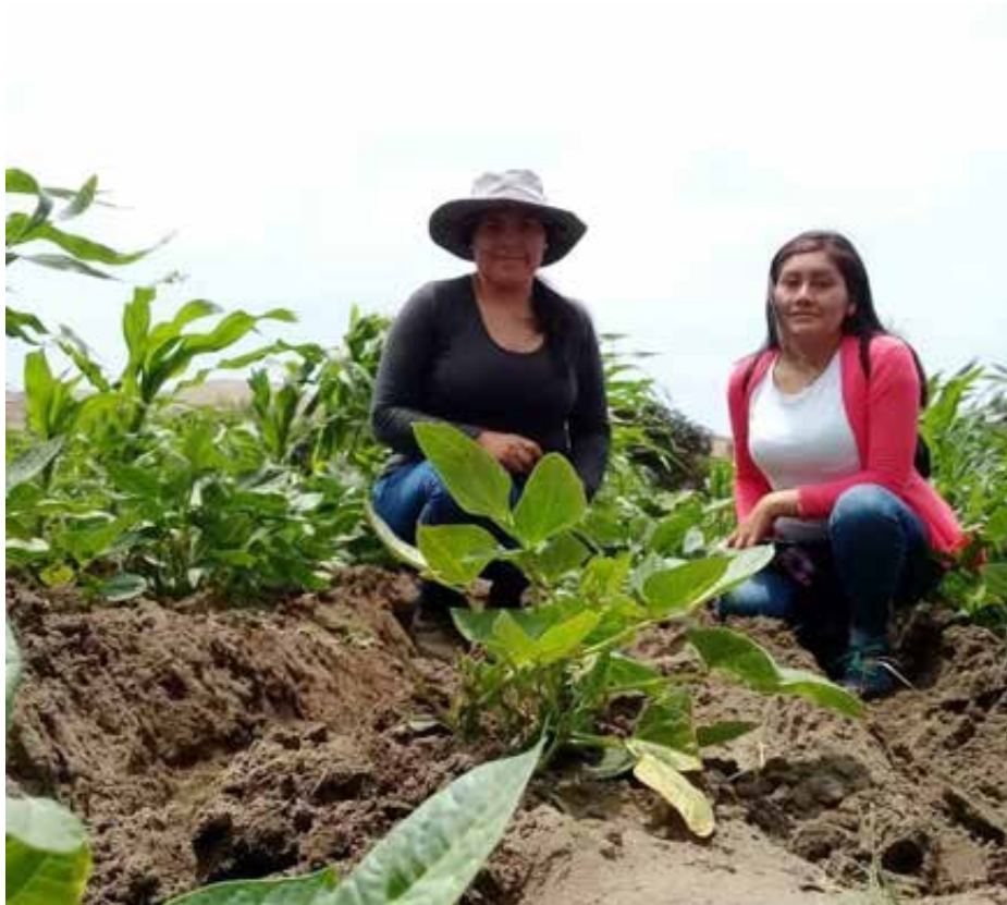
Figura 14. Visita de área de investigación.