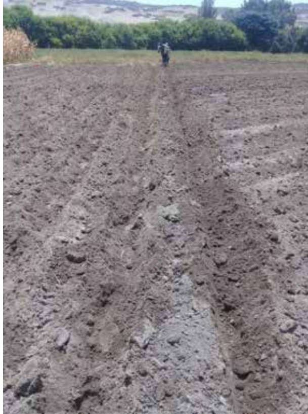
Figura 8. Preparación de terreno – surcado