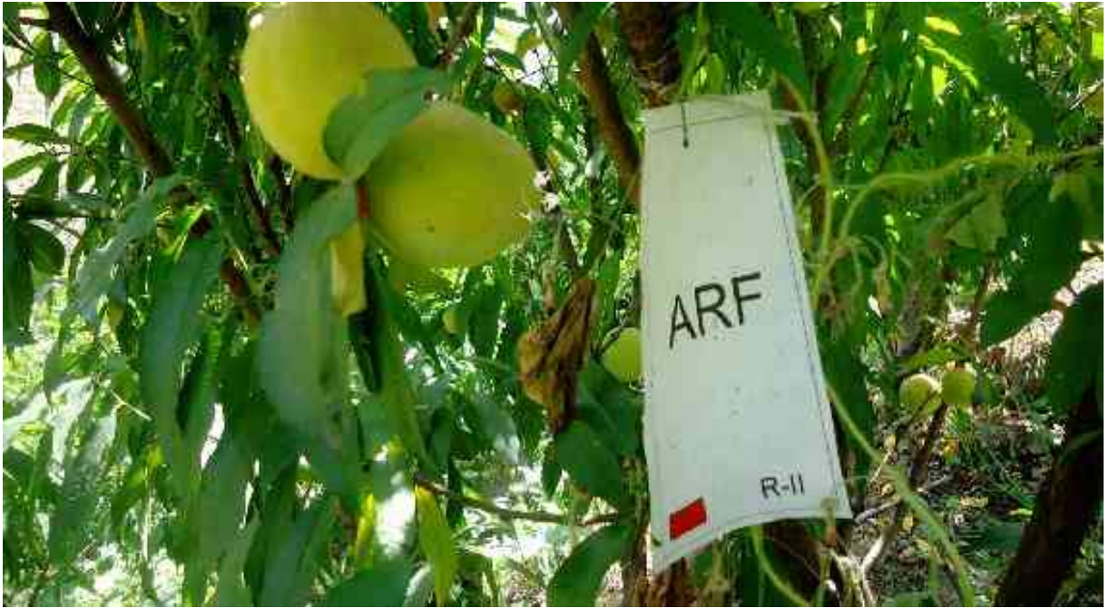
Figura 2. Tratamiento del campo experimental