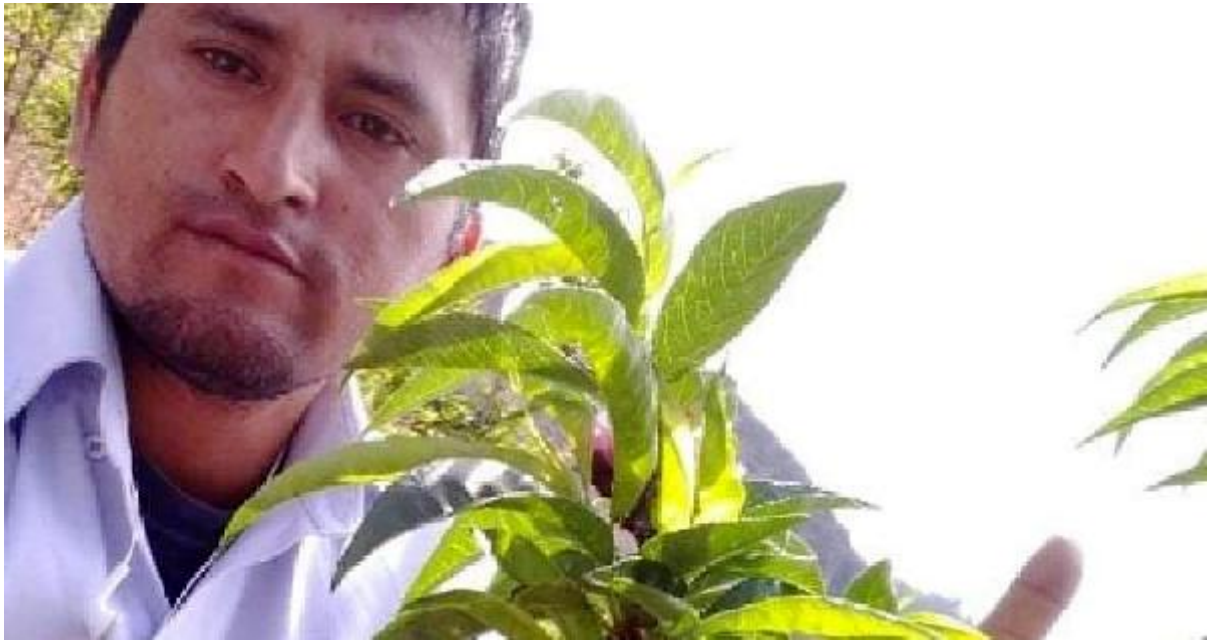
Figura 4. En las evaluaciones.