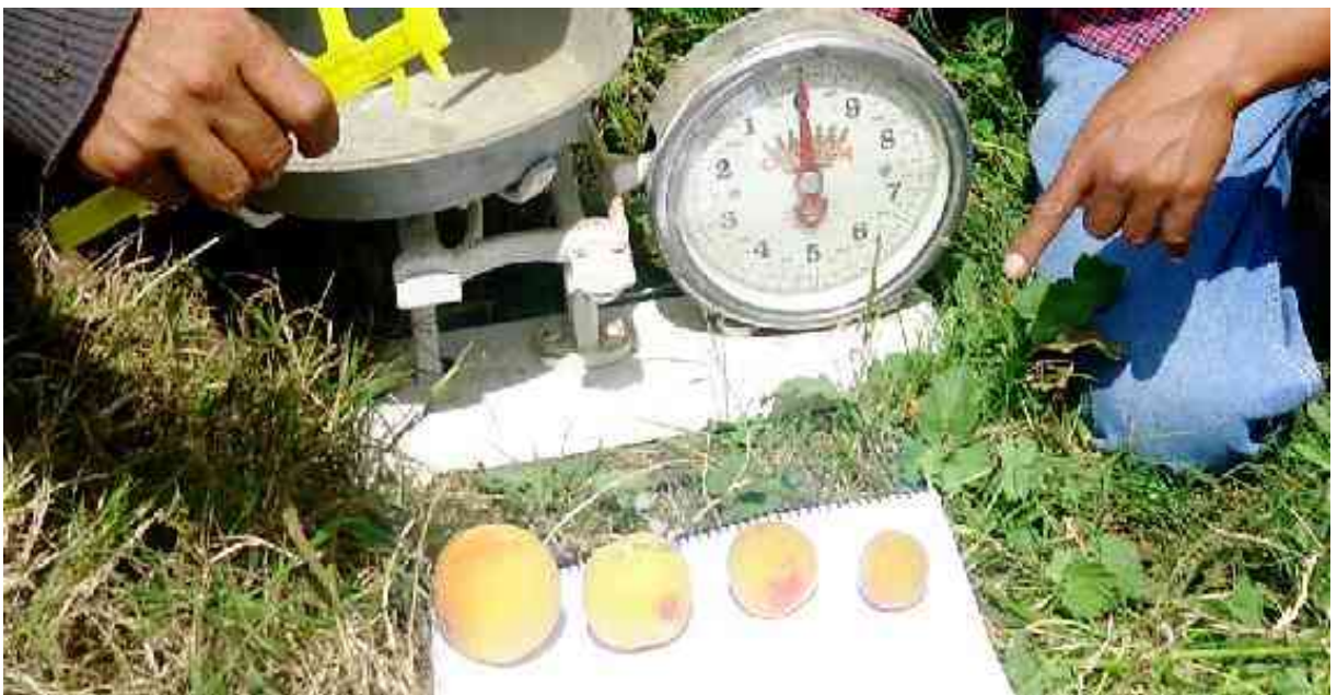
Figura 3. Factores estudiados