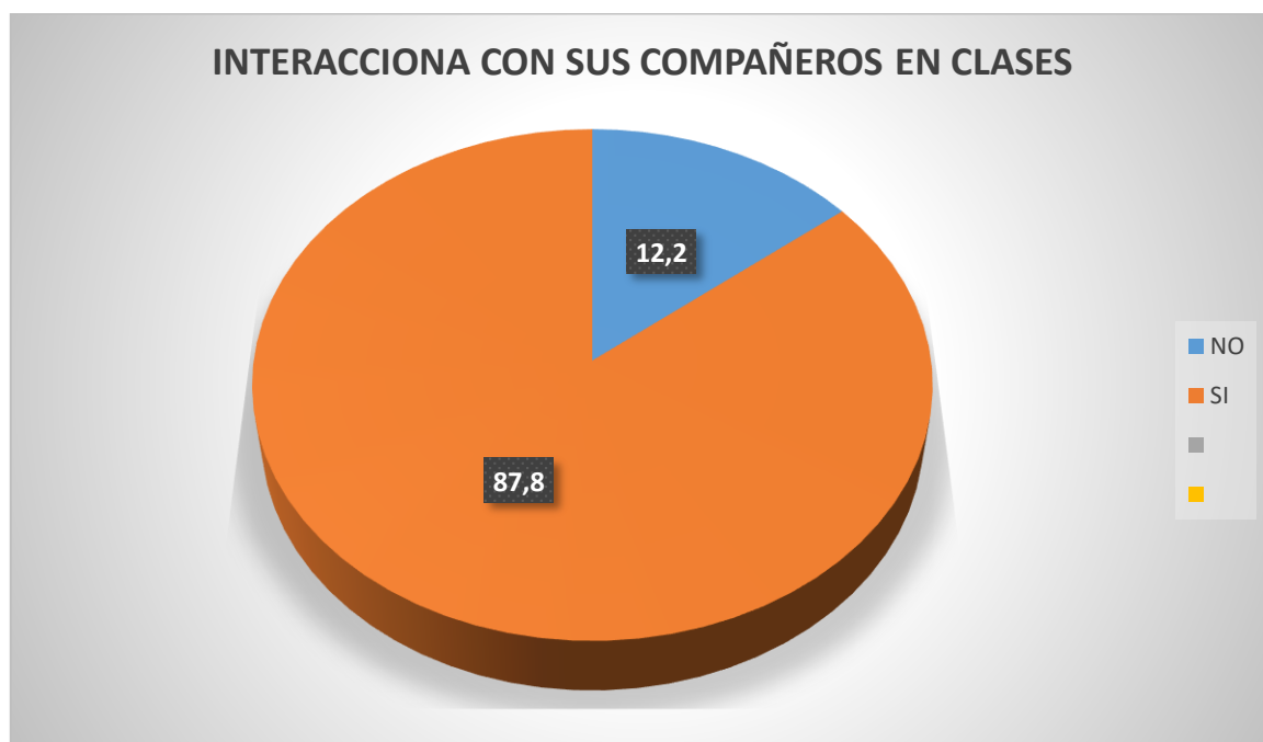
Figura N° 02

En la tabla 2 y figura 2 se observa en los estudiantes del tercer grado de educación primaria de la Institución Educativa N°2040 Julio Vizcarra Ayala Distrito de San Martín de Porras 2019; el 87,8% de los estudiantes si interacciona en las clases con sus compañeros y sólo el 12,2% no participan en las clases.