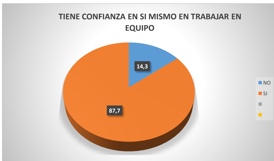
Figura N° 03

En la tabla 3 y figura 3 se observa en los estudiantes del tercer grado de educación primaria de la Institución Educativa N°2040 Julio Vizcarra Ayala Distrito de San Martín de Porras 2019; el 87,8% de los estudiantes si tiene confianza en sí mismo en trabajar en equipo y sólo el 12,2% no participan en el trabajo de equipo.