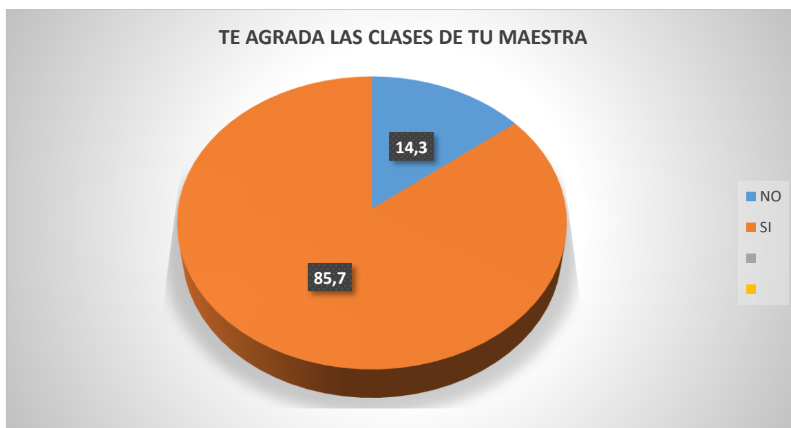
Figura N° 01 Autoestima

En la tabla 1 y figura 1 se observa a los estudiantes del tercer grado de educación primaria de la Institución Educativa N°2040 Julio Vizcarra Ayala Distrito de San Martín de Porras 2019; en relación a la variable Autoestima si presentan un nivel bajo un 85,7% y el 14,3% obtuvieron un nivel alto.