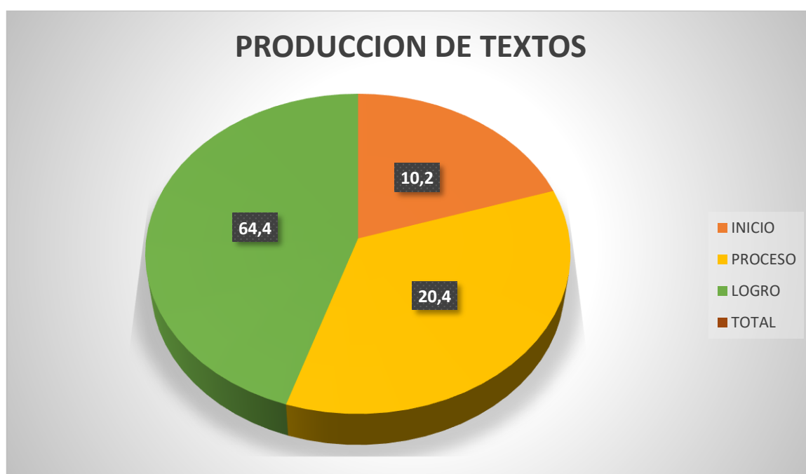
Figura N° 05

En la tabla 5 y figura 5 se observa los estudiantes del tercer grado de educación primaria de la Institución Educativa N°2040 Julio Vizcarra Ayala Distrito de San Martín de Porras 2019; 69,4% de la variable aprendizaje Procedimental del Área de comunicación en su dimensión producción de textos se visualiza que los estudiantes han logrado, el 18,37% están en proceso y el 10,20% se encuentran en inicio.