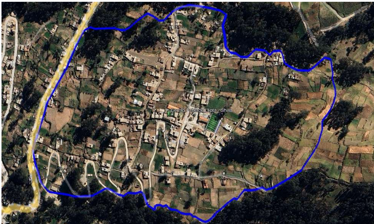
Figura 1. Ubicación del Centro Poblado de Llipta.