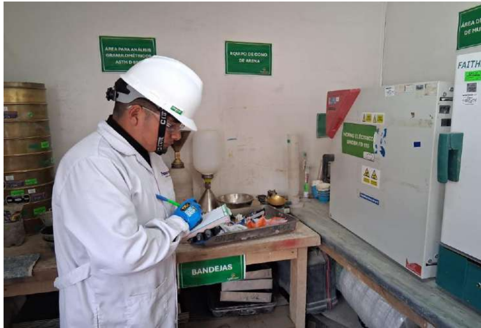
Figura 8. Determinación de la humedad de los residuos sólidos en laboratorio.