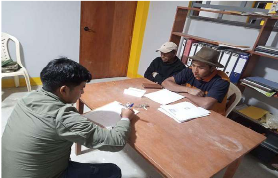
Figura 5. Verificación de gestión de manejo de residuos sólidos