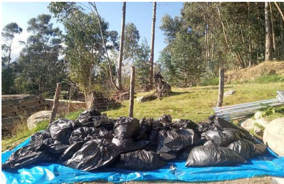
Figura 6. Acopio de muestras de residuos domiciliarios.