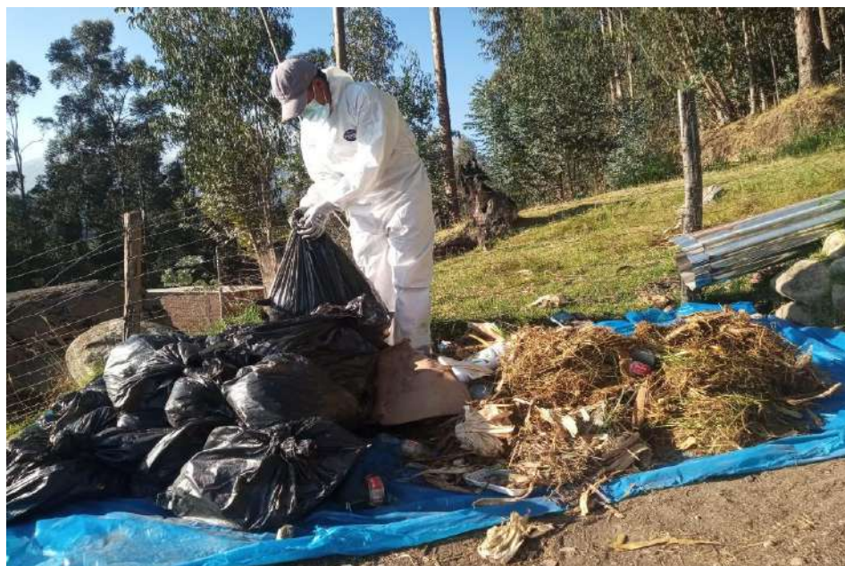
Figura 7. Vaciado de muestras para determinación de composición de residuos sólidos.