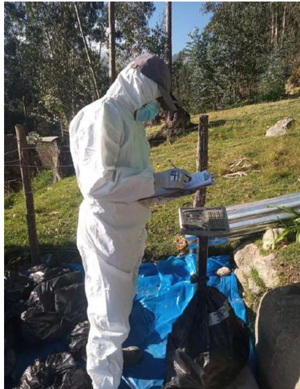
Figura 9. Registro de peso de cada muestra generada por vivienda.