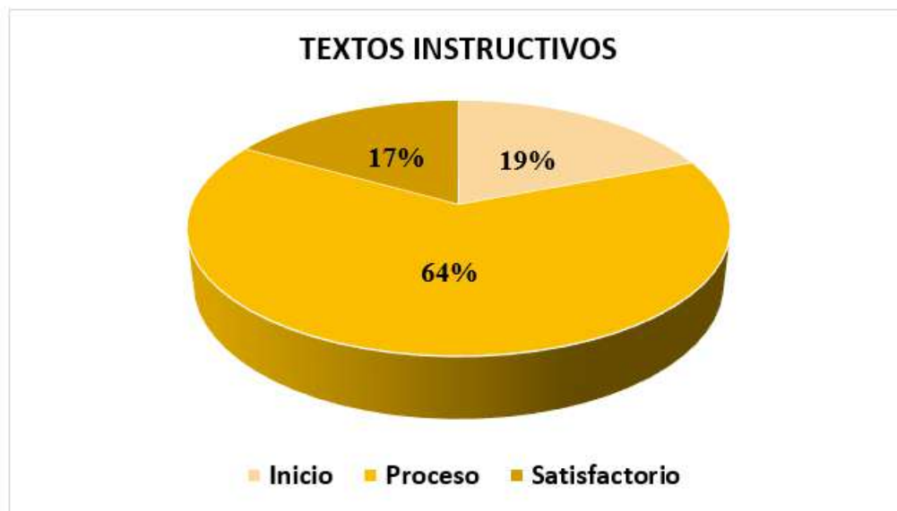
Figura 4 "Porcentaje de comprensión de textos instructivos"

La figura 4, se puede apreciar un 64% de educandos del segundo grado de la I.E. N° 20321 "Santa Rosa" se hallan en proceso de aprendizaje en la dimensión de comprensión textos instructivos, un 17% se encuentra en nivel satisfactorio y el otro 19% en nivel de inicio.