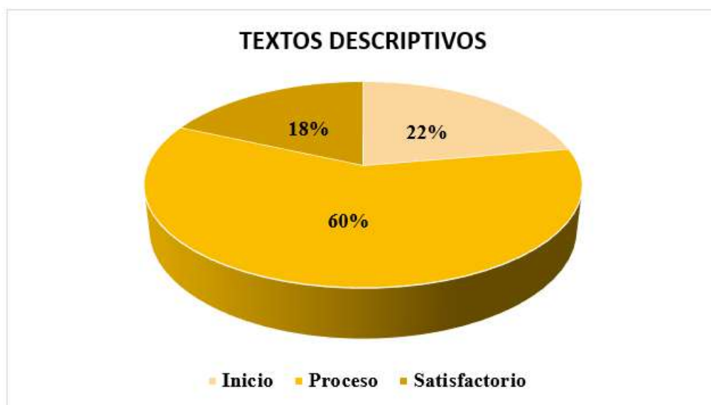
Figura 3 "Porcentaje de comprensión en textos descriptivos"

La figura 3, se puede apreciar un 60% de educandos del segundo grado de la I.E. N° 20321 "Santa Rosa" se hallan en proceso de aprendizaje en la dimensión de textos descriptivos, un 18% se ubica en nivel satisfactorio y el otro 22% en nivel de inicio de este aprendizaje.